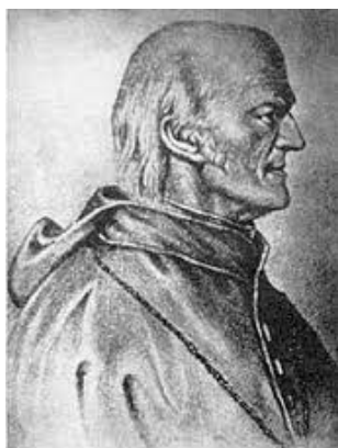
Valentinus Stanič Slika 18 VALENTIN STANIČ

Pomemben del kulturne dediščine Kanala ob Soči predstavlja Valentin Stanič, rojen leta 1774 v bližnjem Bodrežu. Bil je duhovnik, pesnik, alpinist in dobrotnik, znan po svojem vzponu na Triglav in natančni izmeri njegove višine. Močno se je zavzemal za izobraževanje, pomoč revnim in narodno prebujenje. V Kanalu mu je postavljen doprski kip, njegovo delo pa ostaja pomemben del lokalne identitete. V Kanalu je poimenovana Staničeva ulica. Planinsko društvo je novembra 2024 obeleževalo 250 let rojstva Valentina Staniča.