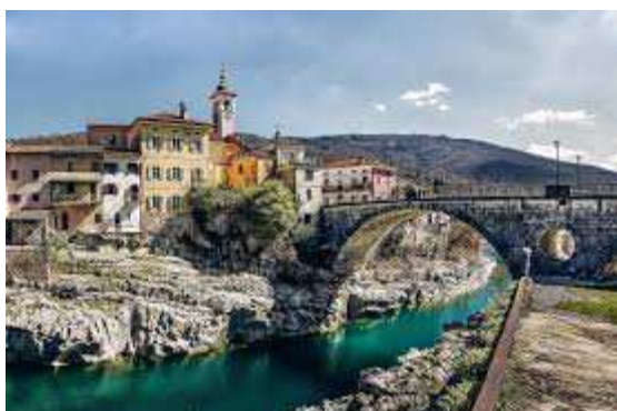
Slika 9 Kanalski most