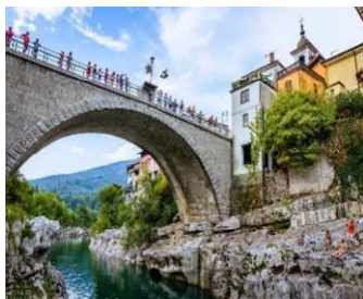
Slika 16 ZNAN KANALSKI MOST