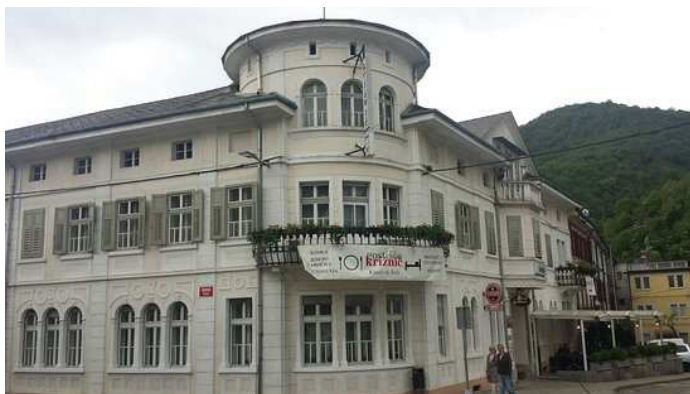
Slika 22 GOSTIŠČE KRIŽNIČ Z ENIM OD OBZIDNIH STOLPOV

Na meniju je lokalna sezonska juha, glavna jed iz svežih sestavin ter sladič. Ob obroku gostje okušajo pristne okuse Posočja, pripravljene po tradicionalnih receptih.