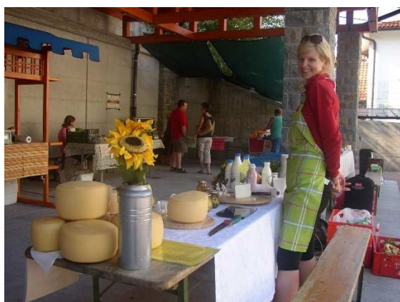
Slika 21 TRŽNIŠČA Z DOMAČIM SIROM