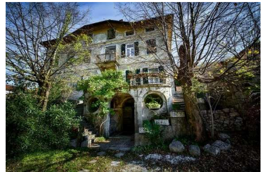
Slika 4 KANALSKI GRAD