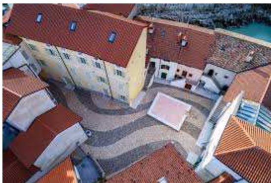
Slika 7 KONTRADA Z VRHA