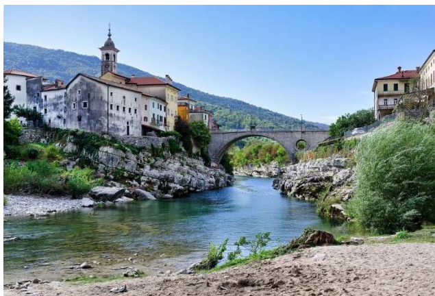
Slika 17 KANALSKI MOST