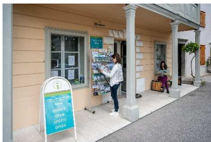
Slika 15 TIKANAL