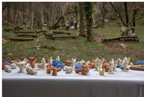
Slika 6 ročno narejena lesna skulptura v parku