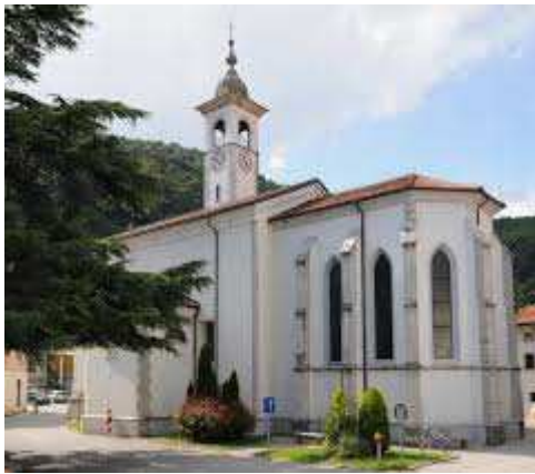
Slika 11 Cerkev Marijinega Vnebovzetja