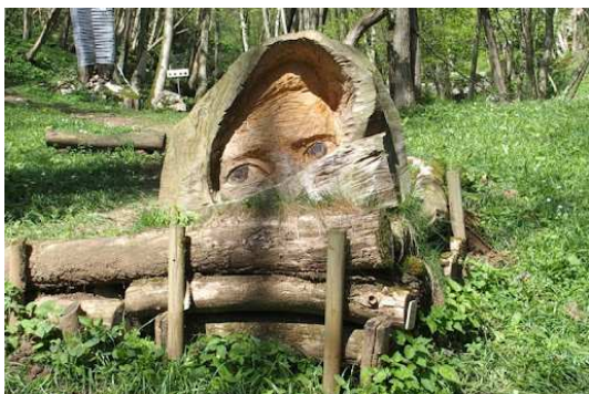
Slika 7 ročno izdelane izdelki iz gline

Vodnik predstavi zanimivosti, kot so posebne rastlinske vrste in pomen območja za krajevno skupnost.