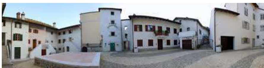
Slika 8 TRG KONTRADA