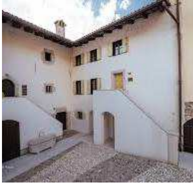
Slika 10 Gotska hiša