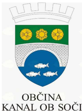
Slika 1 Grb občine Kanal ob SOČI

Kanal ob Soči ima izjemen turistični potencial, saj ponuja raznolika doživetja za vse, ki iščejo stik z naravo, zgodovino in pristno lokalno kulturo.