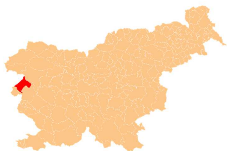
Slika 2 LEGA KANALA NA ZEMLJEVIDU SLOVENIJE

Kanal ob Soči je majhno, a slikovito mesto, ki se nahaja v zahodnem delu Slovenije, ob smaragdni reki Soči, na Goriškem natančneje spodnjem Posočju. Mesto obdaja čudovita narava na eni strani se dviga hribovita Banjška planota, Kanalski Kolovrat pa na drugi strani Soče, ki s svojimi brzičami in tolmeni ustvarja slikovito kuliso. Leži na nadmorski višini približno 103 metrov in meri 3,4 km 2 . Kanal ima okoli 1.150 prebivalcev. Zaradi milega sredozemskega podnebja, ki prekriva soško dolino tukaj uspevajo čiprese in druge zimzelene rastline. Do Kanala se lahko pripeljemo z avtobusom, vlakom, avtomobilom, motorjem tudi z kolesom.