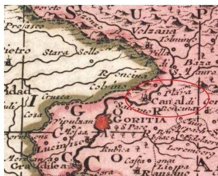
Slika 3 STAR ZEMLJEVID KANALA