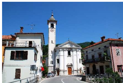
Slika 14 CERKVA MARIJINEGA VNEBOVZETJA