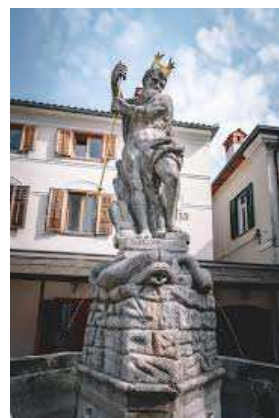
Slika 12 NEPTUNOV VODNJAK

Današnji Kanal je mirno, prijetno mesto z močnim občutkom za tradicijo in naravno dediščino. Kraj še vedno ohranja običaje, kot so skoki z mosta, različne lokalne prireditve in kulinarčna srečanja, kjer lahko obiskovalci okušajo domače jedi in produkte iz okolice.