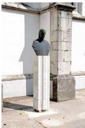
Slika 19 KIP VALENTINA STANIČA