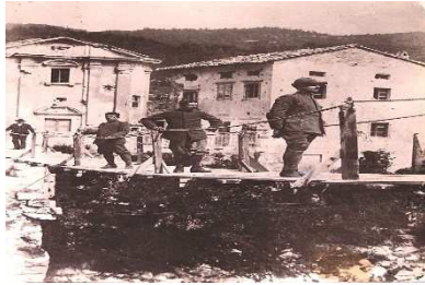
Slika 5 VOJAKI NA KANALSKEM MOSTU

Ime Kanal se v virih prvič omeni že v 12. stoletju, najverjetneje pa izvira iz latinske besede canalis , kar pomeni "vodna struga" – ime, ki odlično opiše lego in značaj kraja ob reki Soči.